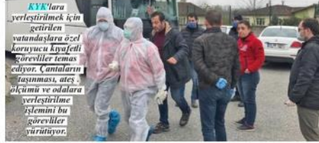
KYK'lara yerleştirmek için getirilen vatandaşlara özel koruyucu kıyafetli görevliler temas ediyor. Çantaların taşınması, ateş ölçümü ve odalara yerleştirilme işlemini bu görevliler yürütüyor.