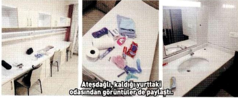
Ateşdağlı, kaldığı yurttaki odasından görüntüler de paylaştı.